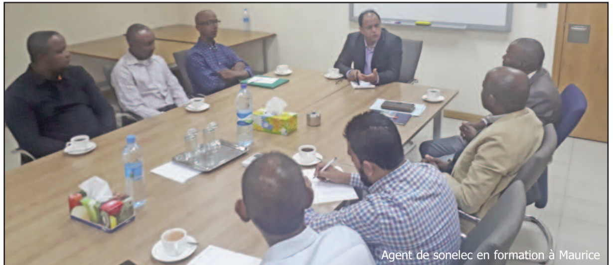
Agent de sonelec en formation à Maurice

Samedi dernier, juste avant leur départ, le directeur général de SONELEC avait organisé une petite cérémonie à leur départ et a montré qu'il s'agit d'une assistance technique née via la Commission de l'Océan Indien (COI) pour une collaboration avec la société mauricienne dans la mesure où le pays est