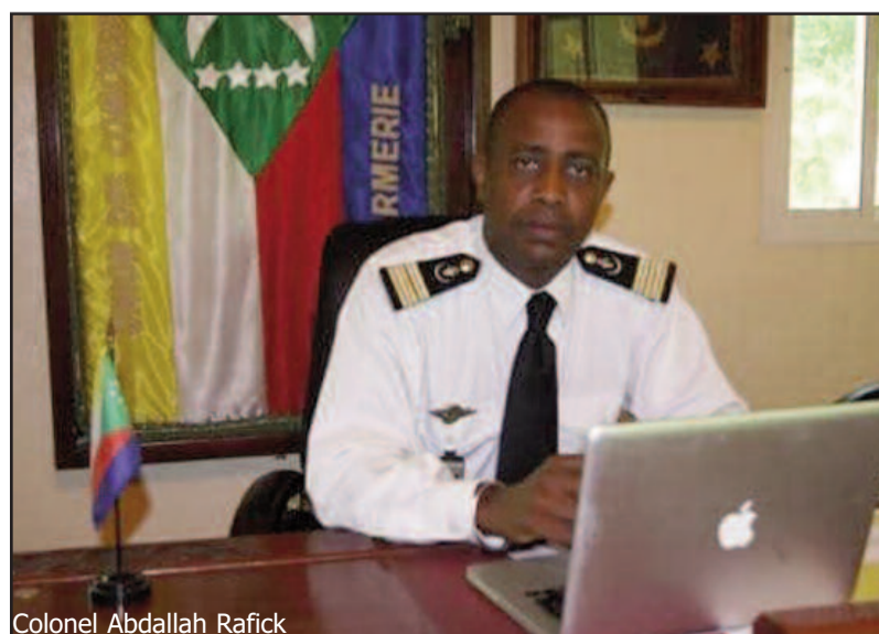
Colonel Abdallah Rafick

À la suite des entretiens menés le 11 juillet 2019 à Bujumbura, le conseil des ministres de la défense et de la sécurité de la région de l'Afrique de l'Est a nommé le colonel Abdallah Rafick au poste de Chef d'Etat major de la composante militaire de l'EASF à Nairobi. Dans sa note, l'ancien commandant de la gendarmerie de l'Union des Comores est appelé à se présenter dès le 1er septembre pour prendre ses nouvelles fonctions.