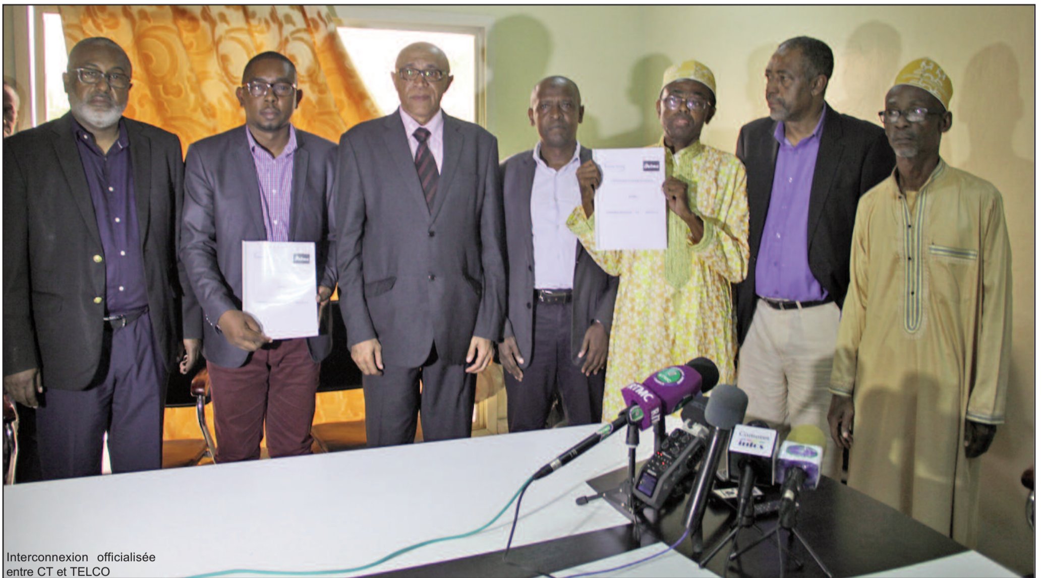
Interconnexion officialisée entre CT et TELCO